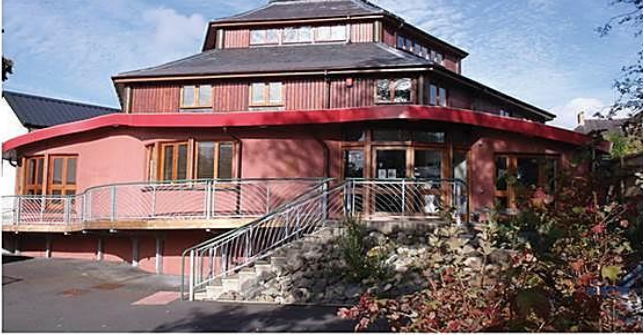
small world theatre theatr byd bychan