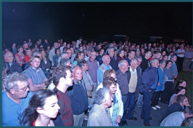
Drwg Yn Y Caws, Gydweithredol/Troedyrhiw