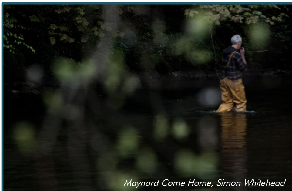
Maynard Come Home, Simon Whitehead

Byddwn yn gwneud cais am gyllid i gomisiynu artistiaid a ddisgrifir uchod yn ogystal â chyllid i redeg nifer o symposia ar ôl cyflwyno'r adroddiad.