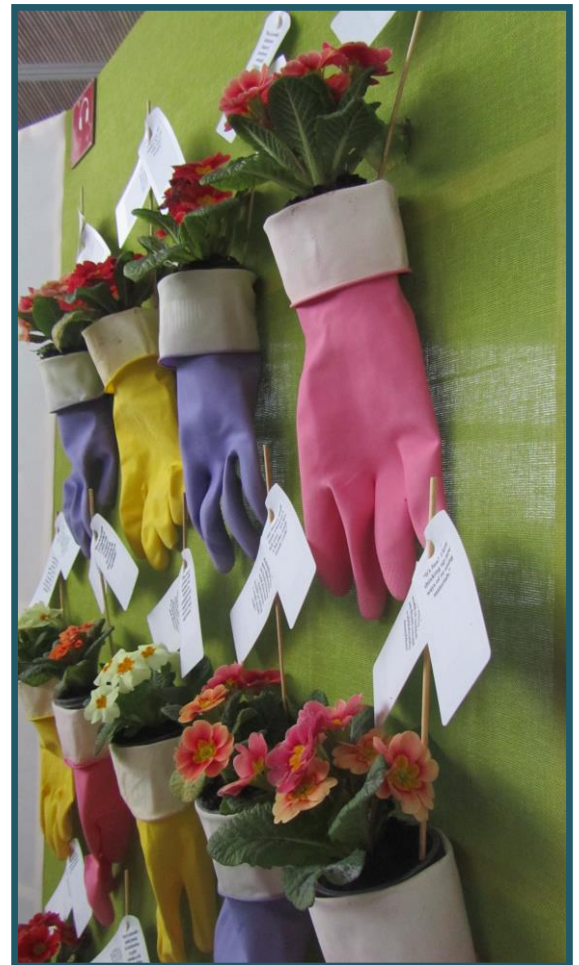
Green Routines, Awe Aman Tawe

Dewiswyd y fîm ar gyfer y prosiect hwn ar sail eu profiad ym meysydd cynaliadwyedd a'r celfyddydau, ac yn cynnwys gwybodaeth am weithio o lawr gwlad i lefel polisi, mewn ystod o genres celfyddydol, a meysydd o gynaliadwyedd.