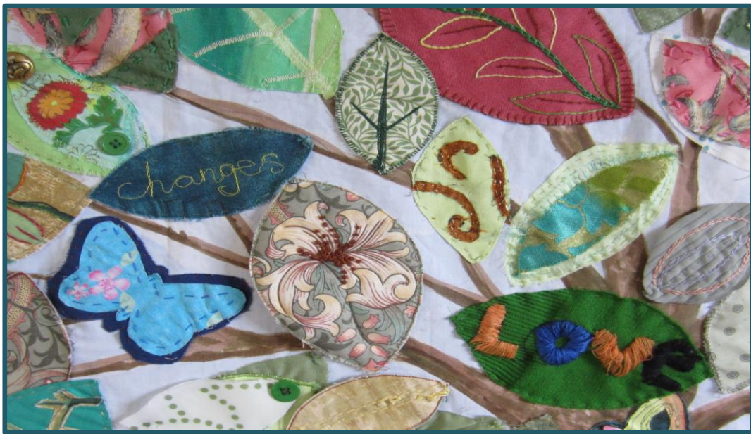
Wall Hanging, Head4Arts