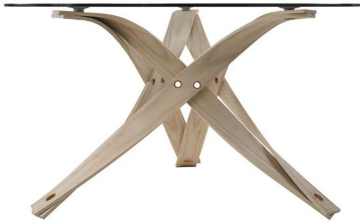
"O" Range Table, David Colwell