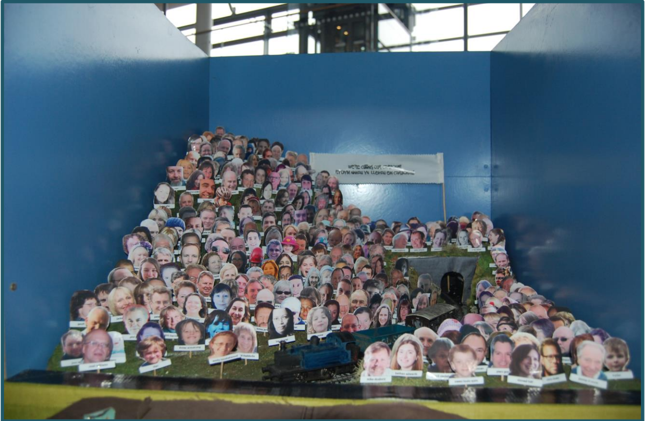
We're Cutting our Carbons, Awel Aman Tawe

Mae hyn yn arwyddocaol. Mae sefydliadau bach neu artistiaid unigol sy'n gweithio ar friwsion neu brosiectau heb ei hariannu, gydag ychydig iawn o gefnogaeth, neu rwydweithiau cefnogi, mewn maes sydd yn 'tabŵ' yn agored i ludded. Mae eu penderfyniad i weithio ar draws dwy sector lle nad oes llawer o arian na chwaith fawr o barch cyhoeddus yn arwydd o'u hymrwymiad i'r maes. Yr hyn sydd angen ar yr artistiaid yma yw cymorth.