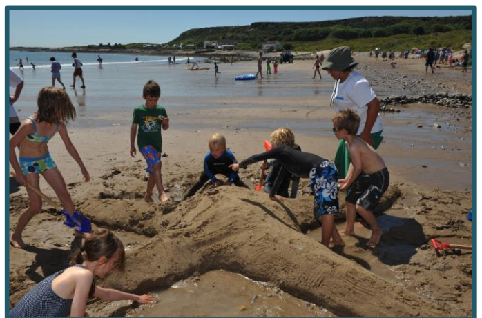
Sculpture by the Sea, Phil Holden

Wrth archwilio newid, mae'n aml yn olrhain o'r sefyllfa yr ydym ynddi, fel y dywed Rabab Ghazoul "Participatory practice is about engaging with what is there. And what is there is everything that individuals making up communities bring", boed hynny mewn cymuned ofodol neu amserol. Mae'r weithred o ddechrau o'r sefyllfa yr ydym eisoes ynddi, heb unrhyw gynlluniau rhagosodedig, yn galluogi eraill i lunio'r prosiect o'r dechrau. Mae'r thema hon yn bwysig wrth wahaniaethu rhyngddo a gwaith agit-prop neu waith sy'n seiliedig ar waith