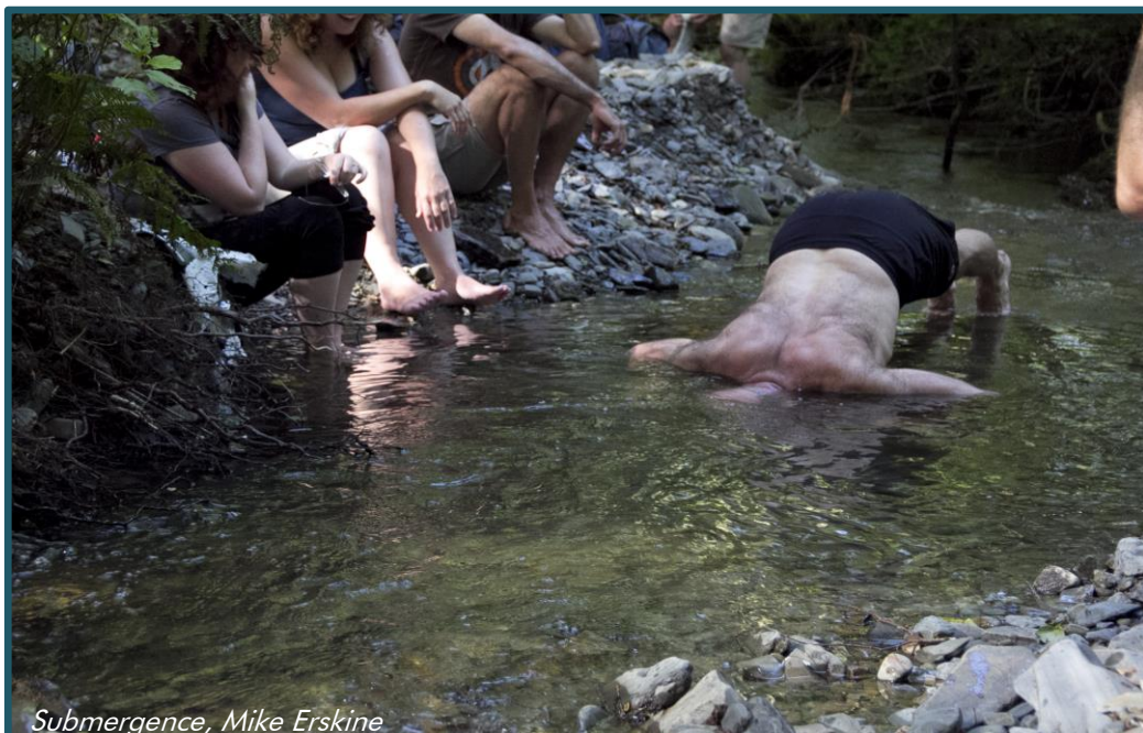
Submergence, Mike Erskine